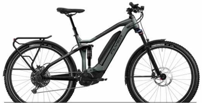
Goroc4 6.50 Black Shading/Black Gloss