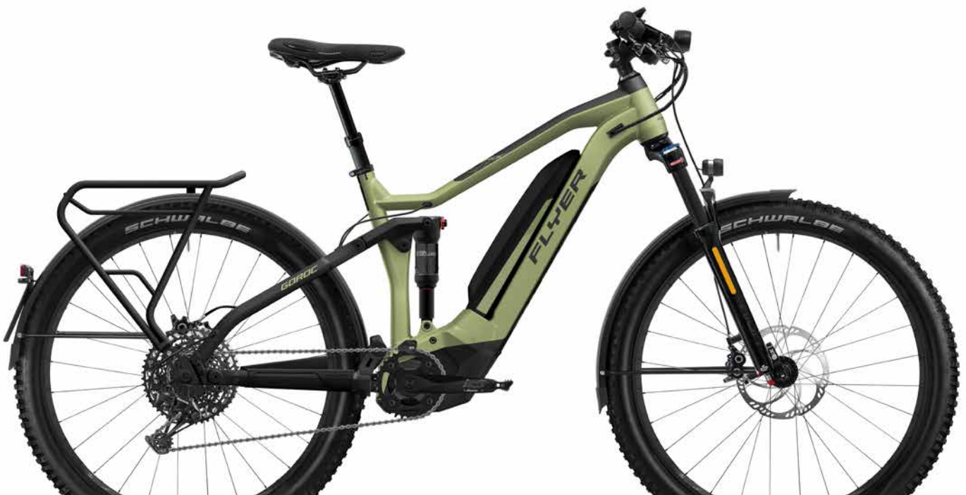
Goroc4 6.50 HS Olive Metallic/Black Matt