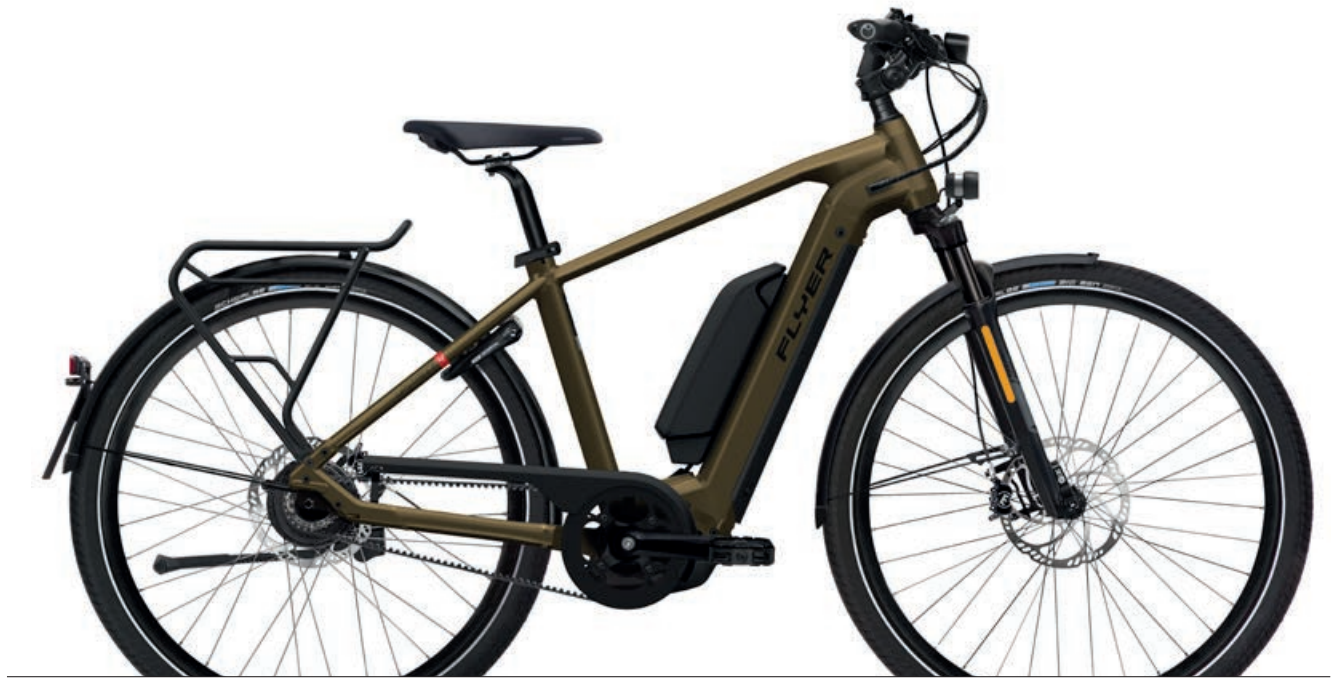
Upstreet4 7.83 Vintage Brass Gloss, Gents

Das Upstreet4 läuft und läuft und läuft und ist der ideale Begleiter für den urbanen Dschungel. Der unermüdliche Langstreckenläufer fühlt sich nicht nur gut an, sondern lässt auch jeden gut aussehen. Wahlweise mit zwei Akkus und bis zu 1125Wh Akkukapazität stellt das sportliche E-Bike für Pendler neue Reichweitenrekorde auf. Der stärkste Bosch Antrieb und die hochwertige Ausstattung unterstreichen die Ausrichtung dieses erstklassigen E-Bikes für Vielfahrer und anspruchsvolle E-Biker. Mit der angenehm sportlichen Sitzposition und dem auf Laufruhe ausgelegten Rahmen ist höchster Komfort auf langen Strecken garantiert. Für schnelles Pendeln ist das Upstreet4 auch in der High-Speed Version mit einer Tretunterstützung bis 45km/h erhältlich. Für das Upstreet4 können die Wege nicht lang genug sein.