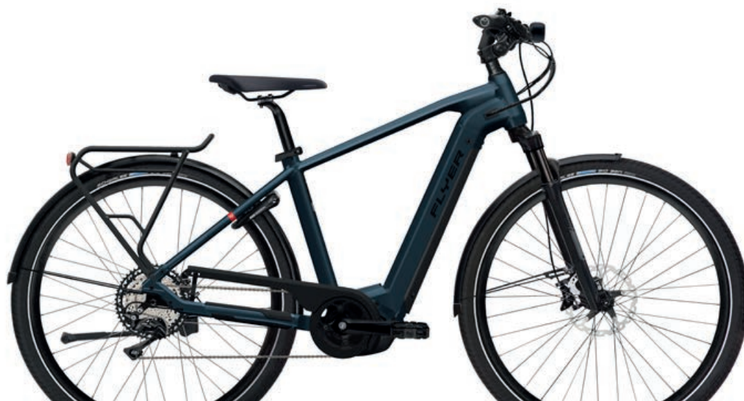
Upstreet4 770 Space Blue Gloss, Gents